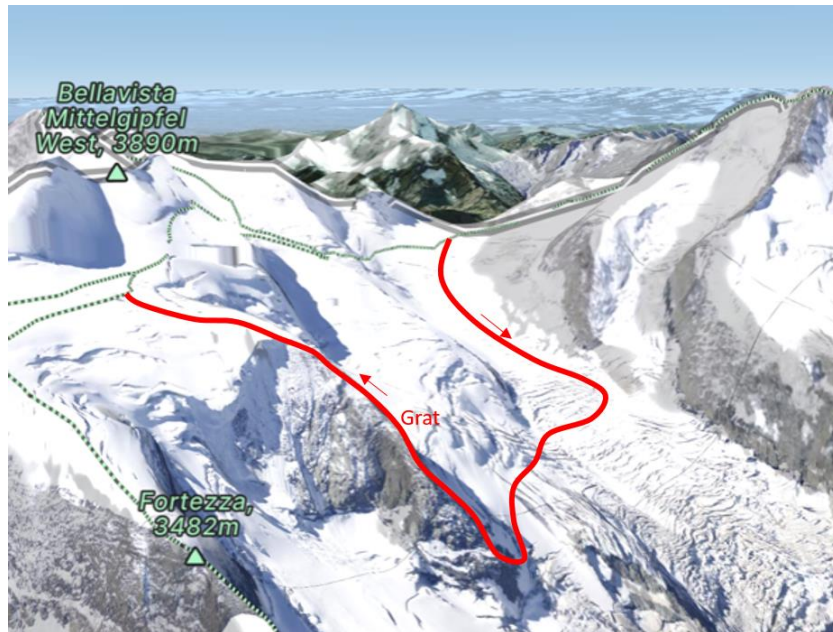
(Ausschnitt aus FATMAP mit rot markierter Route und Gratbereich)