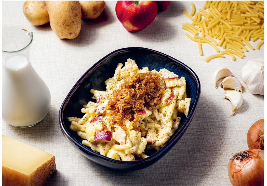
Savoureux macaronis du chalet à la Lidernenhütte SAC

Faire cuire les pommes de terre 5 minutes dans de l'eau bouillante salée.