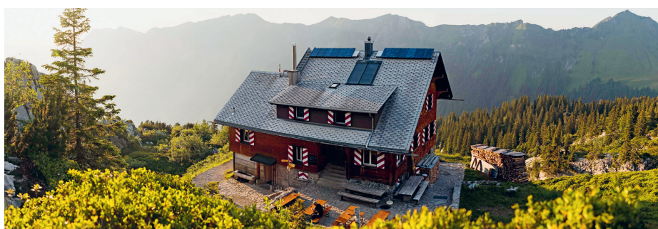
Lidernenhütte SAC avec les anciens panneaux solaires