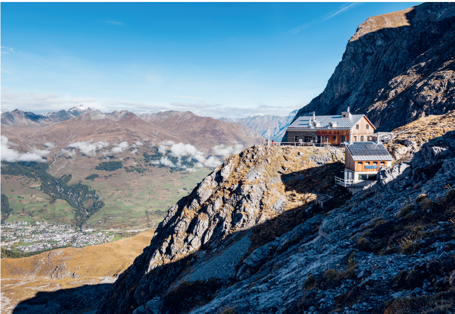
Chamonna Lischana CAS