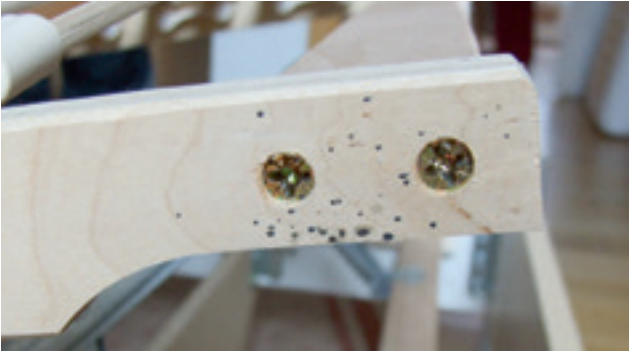
Abb. 1: Kotspuren von Bettwanzen an einem Lattenrost