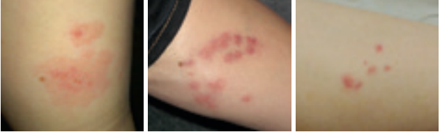
Abb. 3: Beispiele für Bettwanzenstiche

Die Hautreaktion nach einem Stich kann von Person zu Person sehr unterschiedlich ausfallen (siehe Abbildung 3). Manche Menschen zeigen gar keine Reaktion, andere haben juckende und gerötete Pusteln (Durchmesser wenige Millimeter bis einige Zentimeter) oder Blasen und Quaddeln. Die Reaktion kann auch zeitlich verzögert auftreten (bis zu 10 Tage). Daher kann es manchmal schwierig sein zu bestimmen, an welchem Ort man gestochen wurde. Bettwanzenstiche sind meistens gruppenweise bzw. in Reihe angeordnet, können aber auch einzeln auftreten.